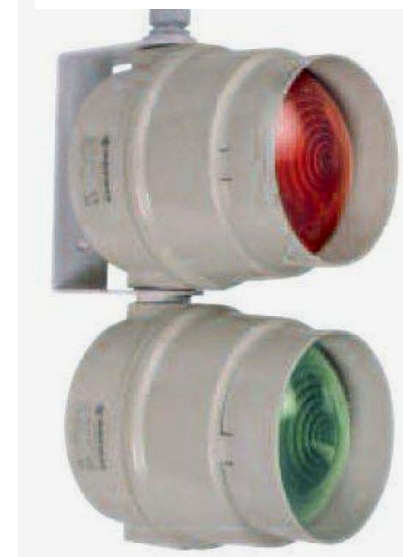
Semafor SE30 k šachetním dveřím.