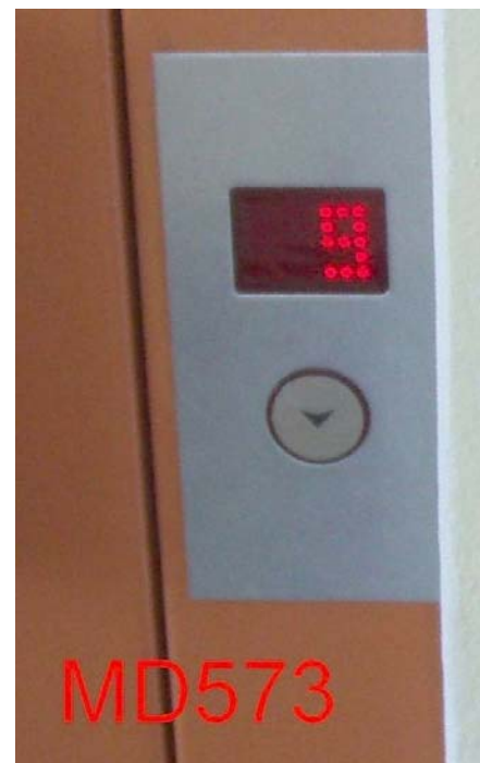
Displej MD 573 pro přivolávač v rámu dveří nebo ve sloupku.