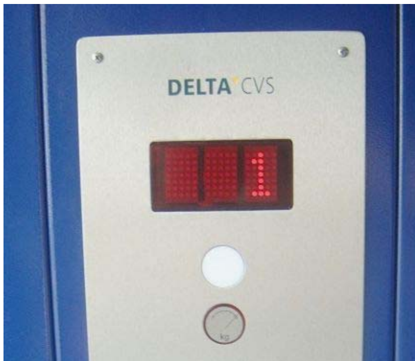
Displej MD32 k použití v kabinovém table a případně v přivolávači vedle dveří.