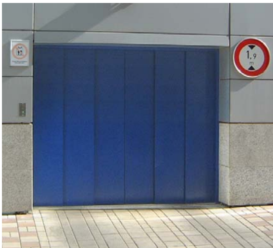
Šachetní dveře 4 dílné automatické centrální

Standardně jsou u výtahů řady DELTA AH instalovány dva typy dveří 4 dílné a 6 dílné automatické centrální dveře. Dveře jsou dodávány v povrchové úpravě vysoce odolný vypalovaný lak Komaxit v odstínu RAL dle výběru ze vzorníku. Dveře lze dodat i v provedení broušený nerez.