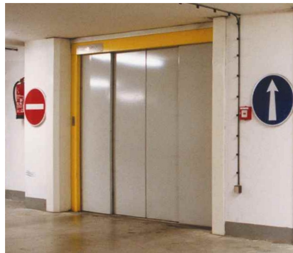
Šachetní dveře 4 dílné automatické centrální