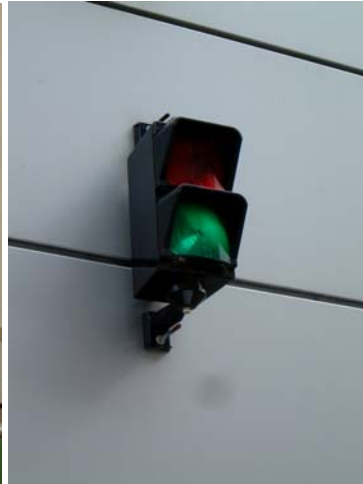
Semafor u vjezdu do výtahu