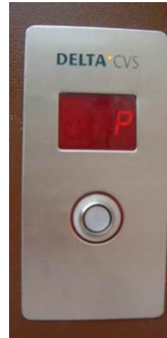
Ovladač se čtečkou čipů