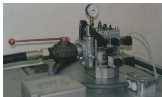
Řídicí jednotka agregátu s ventily