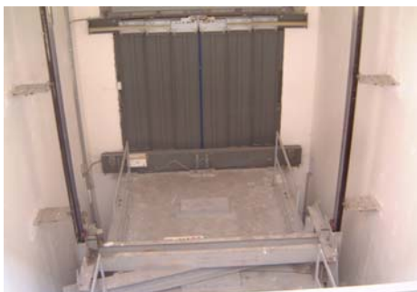
Pohled do šachty

Ve zpravidla zděné nebo betonové šachtě jsou na bocích kabiny pomocí chemických kotvek nainstalovány ocelové konzole s vodítky. Pohon výtahu je zajišťován hydraulickým systémem skládajícím se z dvou hydraulických válců na bocích kabiny a hydraulického agregátu umístěného v samostatné strojovně v blízkosti šachty výtahu. Rám kabiny je veden kluzným vedením s vložkami a je vybaven zachycovacím zařízením. Při nižším zdvihu jsou písty uchyceny přímo k rámu kabiny (výtah s pohonem 1:1). U vyšších zdvihů (cca přes 3,5 m) je pohyb kabiny zajišťován ocelovými lany přes lanové kladky, které jsou osazeny na koncích pístů. Lanováním je v tomto případě v poměru 1:2.